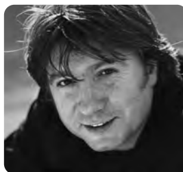
Werner Boote, Regisseur des Dokumentarfilms „Plastic Planet“

Wenn ich alte Filmaufnahmen von mir sehe, wie ich als Kind mein heißgeliebtes Plastikspielzeug knuddele, wird mir mulmig. Damals in den 60ern waren die Gefahren von Plastikzusatzstoffen noch kein Thema. Heute sind die Risiken längst wissenschaftlich belegt – es ist ein Skandal, dass Kinder trotzdem noch nicht ausreichend geschützt werden!