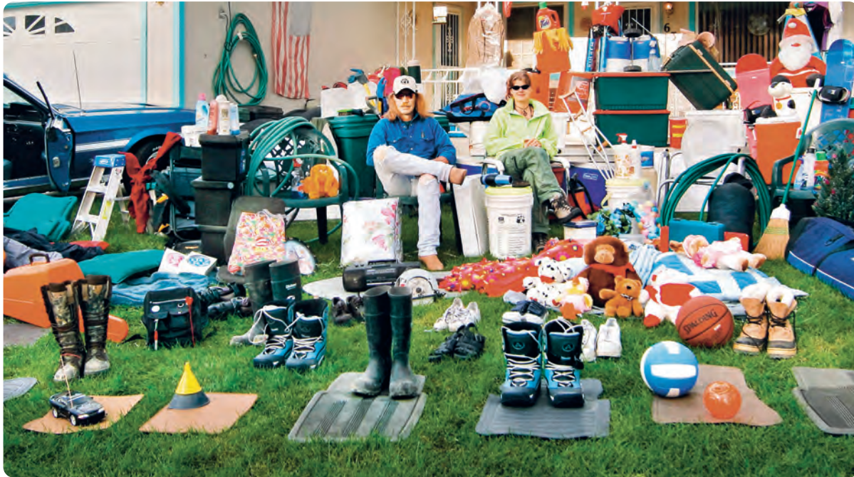
Wir sind im Haushalt umgeben von Produkten aus Kunststoff. Eindrucksvoll zeigt es dieses Bild aus dem Kinofilm „Plastic Planet“.